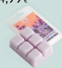
Lavanda e Bergamotto