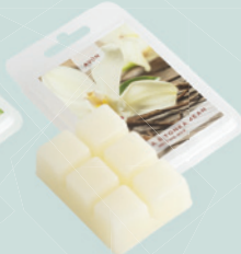
Vaniglia e fava Tonka