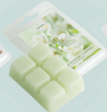
Gelsomino bianco e Neroli